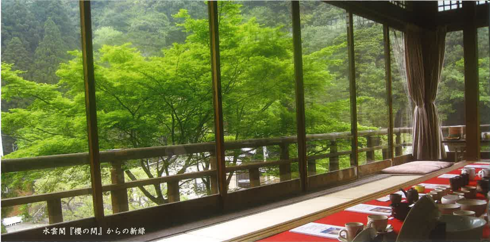
水雲閣『櫻の間』からの新緑