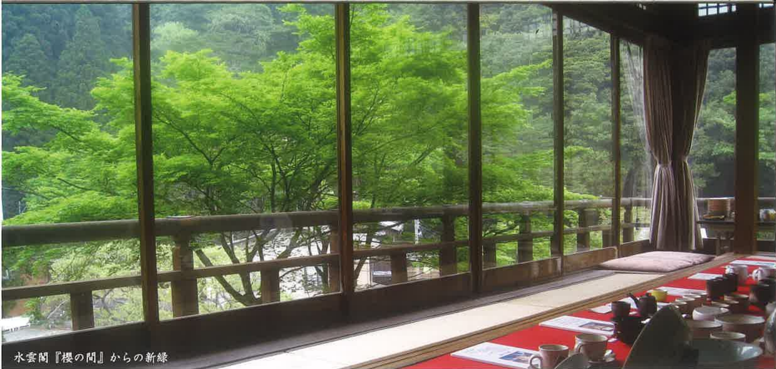
水雲閣『櫻の間』からの新緑